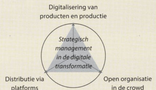
Figuur 1. De drie pijlers van de digitale transformatie

Digital by default Willem Peter de Ridder Mijnmanagementboek.nl ISBN 9789463187817 € 24,90